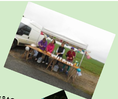
C'était la fête