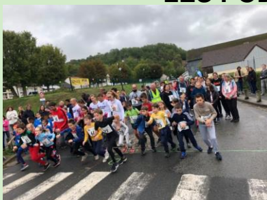
Ils courent après le temps et la mémoire pour France Alzheimer