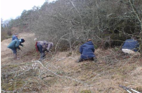
Photos avant/après chantier pour illustrer le travail effectué.