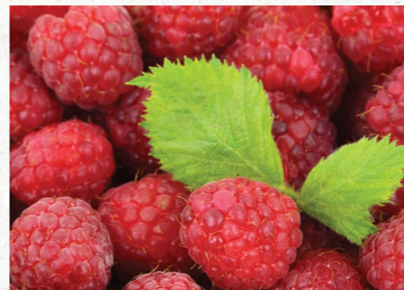
La recette de Valentine

- Agression, vol, cambriolage, violences physiques, sexuelles, harcèlements, cyber malveillances ou d'autres infractions, accidents, catastrophes naturelles, ... Composez le 116 006, une plateforme téléphonique destinée aux victimes d'infractions.